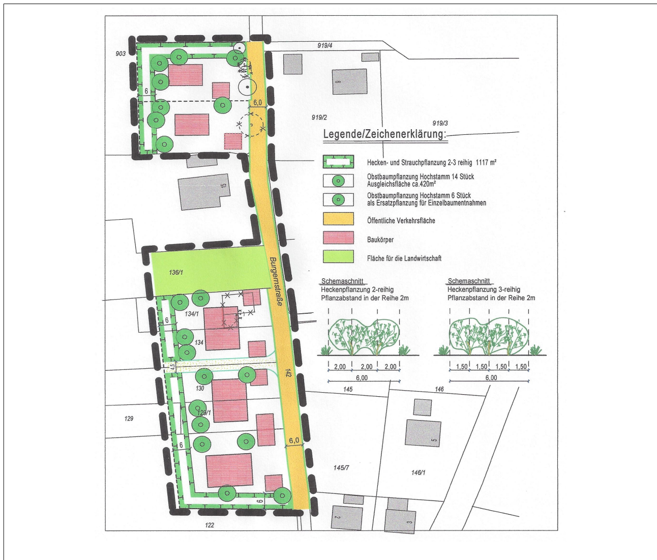
Abb. 3: Ausgleichsflächen (Hecken- und Strauchpflanzung und Baumpflanzung ges. ca.1537m 2

Lage der Ausgleichsflächen: (Lageplanauszug)