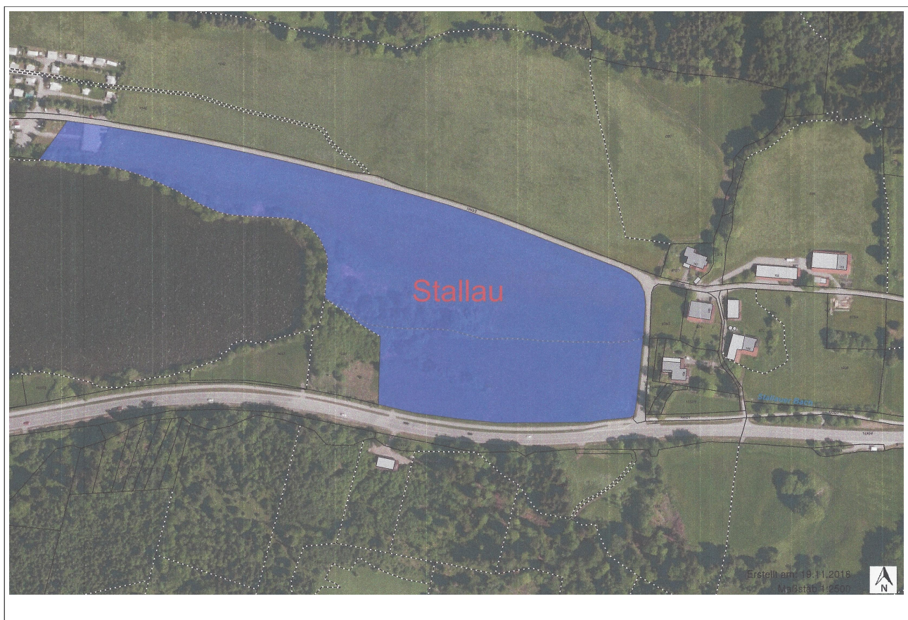
Abb. 1: Luftbild (oh. Maßstab)

Standortalternative: Grundstück in Stallau.